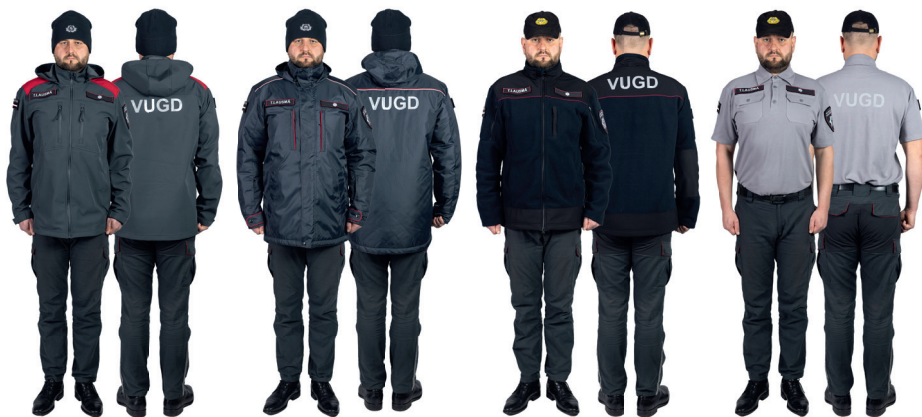
UGUNSDZĒSĒJS GLĀBĒJS UN INSPEKTORS