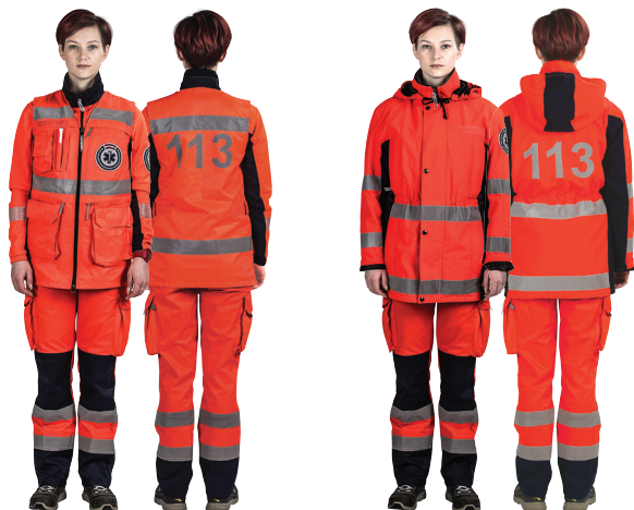
NEATLIEKAMĀS MEDICĪNISKĀS PALĪDZĪBAS DIENESTA BRIGĀDES DARBINIEKS